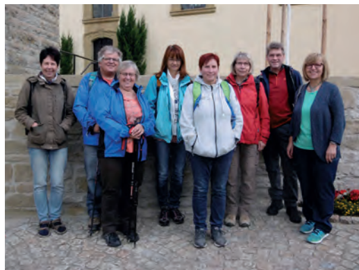
Teilnehmende am Pilgertag 2018 vor der Jakobuskirche in Binsbach.

Das ist Pilgern: In der Gemeinschaft mit anderen einen Tag Pause vom Alltag einlegen, sich Zeit für sich nehmen, in der Natur erholen und spirituelle Erfahrungen sammeln. In den am Weg stehenden Kirchen gibt es die Möglichkeit, sich zu besinnen und zu beten.