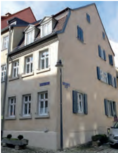
Geschäftsstelle Krumme Gasse 25 97421 Schweinfurt Tel. 09721-793 23 56 mail: info@efsw.de www.efsw.de